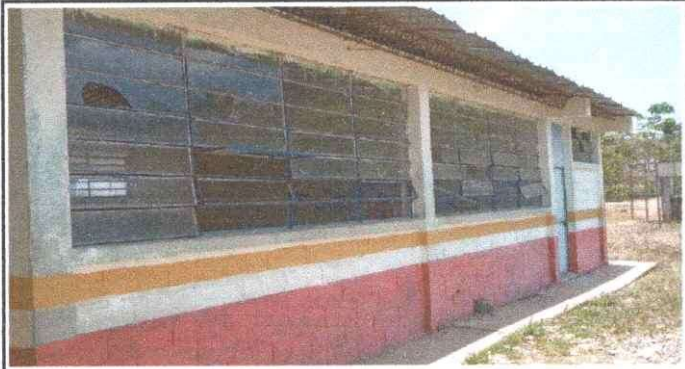
Foto 3: SE OBSERVA EN AREA DE VENTANERIA PIEZAS DE VIDRIO EN MAL ESTADO DEL MODULO 1.