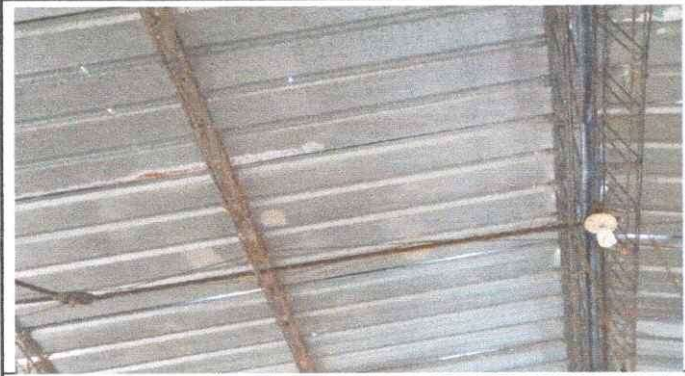
Foto1: SE OBSERVA LAS ESTRUCTURAS PORTANTES DEL MODULO 1.